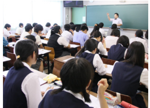
毎年、大人気の大槻先生による小論文講座

質問が書かれたワークシートを埋めたうえで、小論文作成に入ると、スムーズに所定の文字数が埋まっていきます。